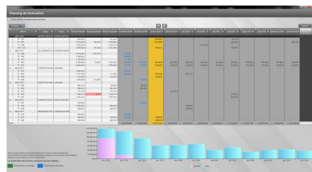
Planning des prévisions de facturation

En ce qui concerne les factures clients, vous pouvez planifier le montant à facturer par affaire, par phase et par mois. Vous obtenez ainsi un planning de prévisions de facturation.